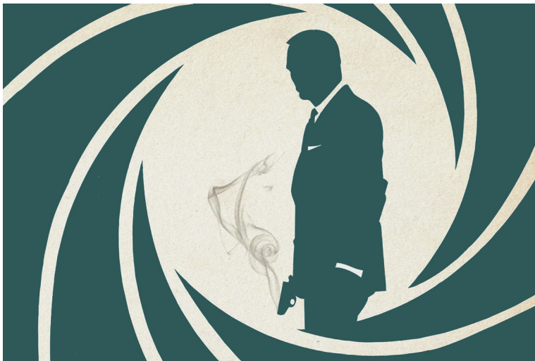
Het Gelders Orkest speelt muziek uit James Bond films op 18 mei in Muis, Arnhem.

Interesse? Dirkzwager gaat honderd exemplaren van deze uitgave verloten. Wilt u kans maken op toezending van een gratis exemplaar? Stuur een mail met uw gegevens naar marketing@dirkzwager.nl onder vermelding van 'Boek Maurits Martijn'. De winnaars krijgen na de loting het boek gratis toegezonden. Over de uitslag kan niet worden gecorrespondeerd. U kunt zich voor het Privacy Evenement aanmelden op www.dirkzwager.nl onder 'events'. U vindt hier tevens het complete programma. Meer over privacy en gegevensbescherming op pagina's 11 tot en met 13.